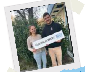
LANDESAUSSCHUSS IM MÄRZ

“ Zwischen “Ich kann das nicht...” und “Jetzt verstehe ich!” liegt unsere Arbeit. ”