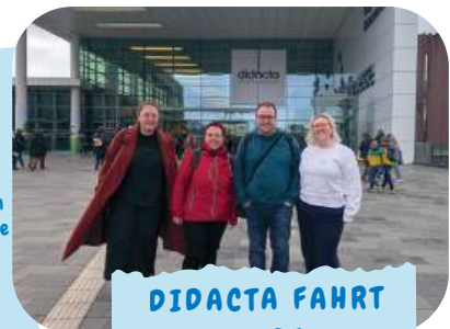
DIDACTA FAHRT 2026

Sei auch du dabei! Wir haben immer wieder spannende Veranstaltungen für dich. Schau auf Instagram oder unserer Website vorbei und bleib UP-TO-DATE!